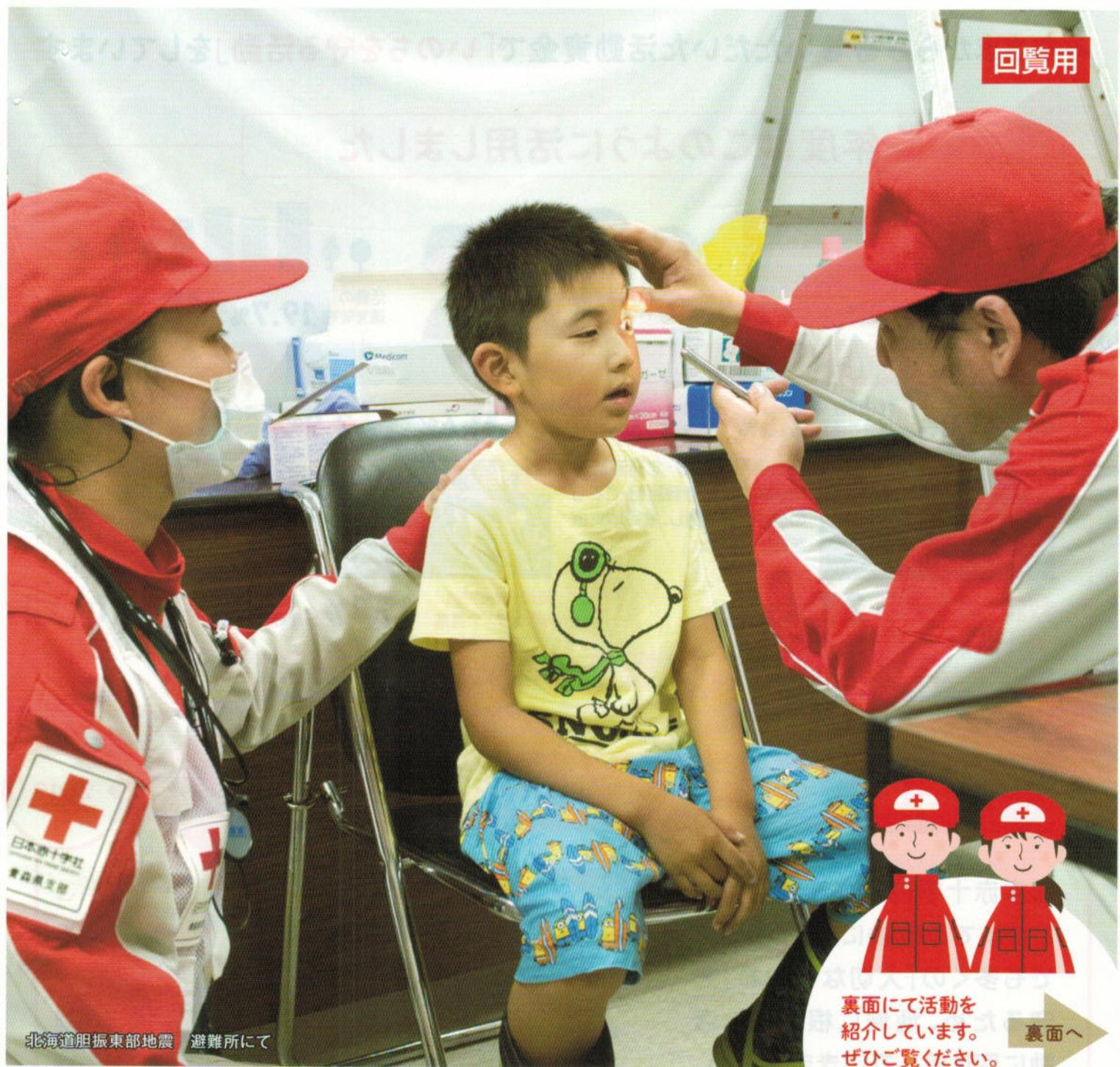
北海道胆振東部地震 避難所にて