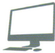
デスクトップパソコン